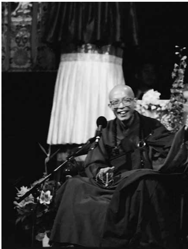
▲ 1998年在美国纽约的玫瑰广场，圣严法师和达赖喇嘛展开汉藏佛教的首度对谈。