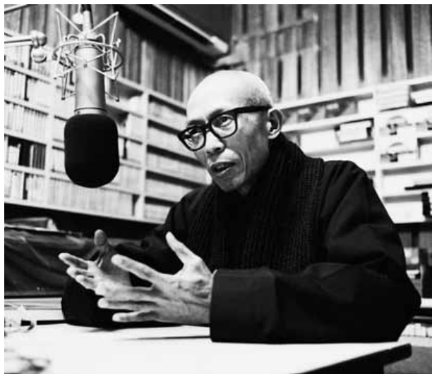
▲聖嚴法師經常透過不同媒體，闡述其建設人間淨土的理念。