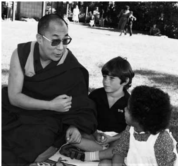
▲達賴喇嘛作風親切，甚受西方人士歡迎。