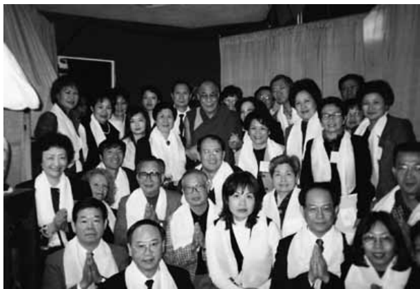
▲在對談會場的幕後，達賴喇嘛與法鼓山資深悅眾合影。